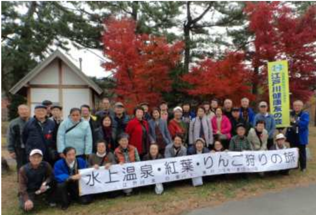
あざやかな紅葉の前で（カラーでお見せできないのが残念です）