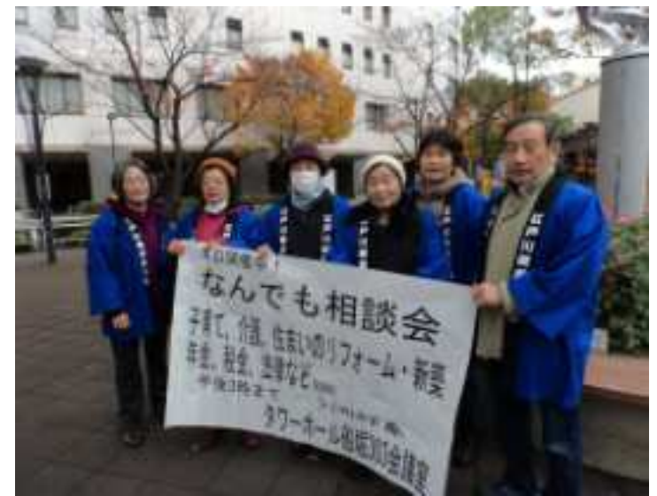
船堀駅前案内チラシの配布に参加した会員→

11月23日 水・祝（午前10時から午後3時まで江戸川社保協主催の「なんでも相談会」が、タワホール船堀303会議室で開催されました。友の会13名を含め40名を超えるスタッフが相談・宣伝等にがんばりました。