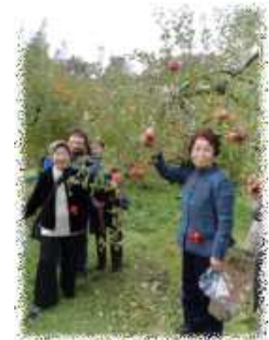
見て～このリンゴおいしそう！

足利フラワーパークで昼食をとりながら花を見ました。このライトアップは世界一の評判で、イルミネーションで創った藤やバラの花、たくさんの絵を見て感動しました。