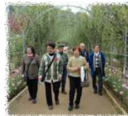
頭上には藤、足元にはたくさんのイルミネーションの花々が...