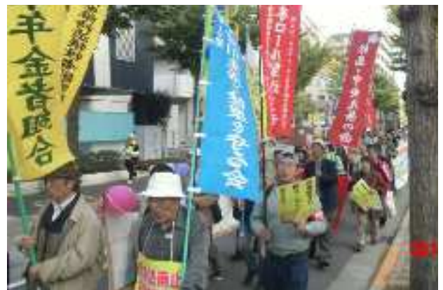
街の人に訴えながらパレード

意」が崩れた、まさに戦闘現場。政府は「首都は平穏」「戦闘でなく衝突だ」「安全」というけれども、どこで銃撃されるかわからない状況だそうです。訴えを聴けば聴くほど、自衛隊員を危険にさらす危機感をいただきました。