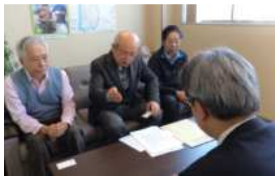
江戸川健康友の会は、11月17日、江戸川大気汚染をなくす会と共に区内の労組・民主団体に署名促進の協力要請行動を行いました。

東京の大気汚染公害被害者・ぜん息・慢性気管支炎・肺気腫）が、大気汚染をなくし、損害賠償と被害者の全面救済を求めた裁判を11年間たたかい、東京高裁で勝利的和解をしてから9年が経ちました。