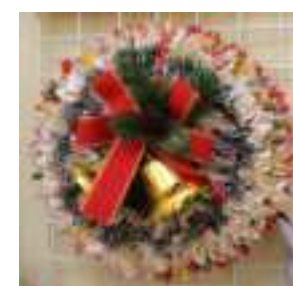
クリスマスリース 南葛西 正木千恵

今年もインフルエンザの予防接種を受けて、元気な冬を過ごしましょう。友の会と連携する区内3ヶ所の診療所で利用できます。予防接種料金 3,780 円のところ 3,402 円 で受けられます。