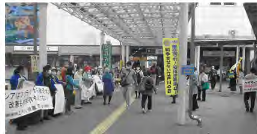
友の会は年金者組合や9条の会会員と共に、ステッカーやプラスターを掲げて行動しました。