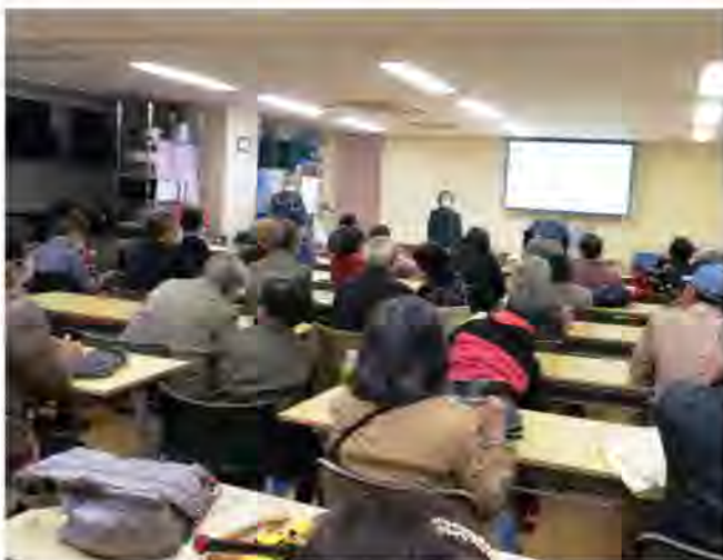
出演者と映画の内容に関心がたかく大盛況でした