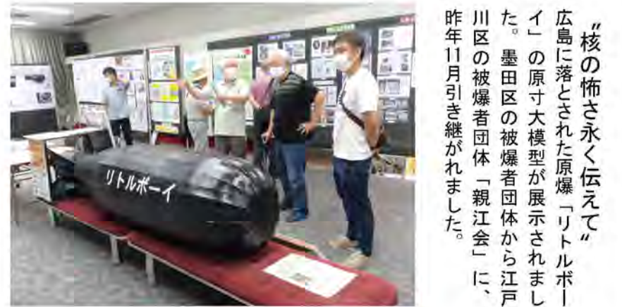
「核の怖さ永く伝えて」広島に落とされた原爆「リトルボーイ」の原寸大模型が展示されました。墨田区の被爆者団体から江戸川区の被爆者団体「親江会」に、昨年11月引き継がれました。